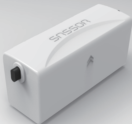
単3電池タイプの形状イメージ

“ 電気機器の電源ケーブルを挟みこむだけで、個別機器の消費電力を計測可能な低コスト電力センサー ”